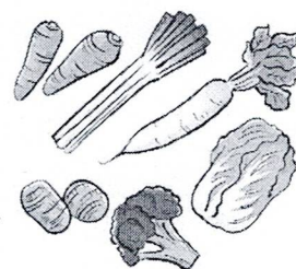
野菜の種類、量は未定です。