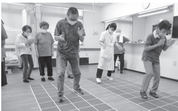
リバイバルダンス(上)とスクエアステップ(下) 班会でも、気の合う仲間の集いでも気軽にできます。